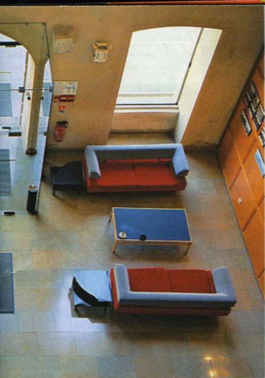
Sopra: un interno della sede dell'Ena, a Strasburgo.