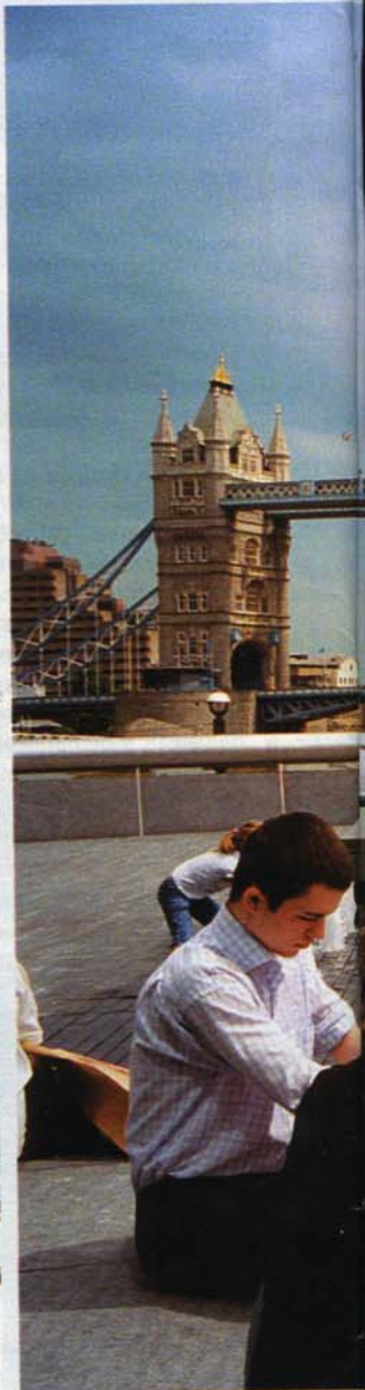
Stoccolma, il Freizeit Park. A destra: giovani manager in pausa pranzo davanti al City Hall, a Londra, disegnato da Foster and Partners

Esiste da qualche parte una terra incantata dove le donne affollano il Parlamento, dirigono aziende e tornano a casa ad allattare i figli. Un paese dove i treni sfrecciano a 300 all'ora già da 15 anni e arrivano puntuali al minuto. Uno dove i ventenni non sono considerati ragazzini, ma manager in carriera e